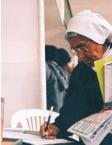
Cambio Clamático: monja de Puno firma su interes en baños ecologicos

El 17 de octubre, yo miraba cuando la gente de Perú compartía con el gobierno y el mundo que significa el cambio climático para ellos. La Audiencia Nacional sobre Cambio Climático fue organizado por el Movimiento Ciudadano frente al Cambio Climático (MOCICC). Fue un día dedicado a escuchar la situación del calentamiento global está afectando el pueblo peruano y para preparar la Conferencia de las Naciones Unidas de Cambio Climático en Copenhague.