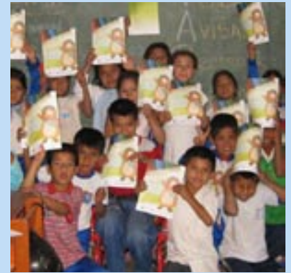
Niños de Paz y Esperanza

Aquí abogados, pastores, consejeros, periodistas, etc. satisfacen las necesidades de las victimas. Ofrecen consejo, tanto psicológica como espiritual, proporcionan ayuda legal a aquellos que quieren presentar cargos o separarse