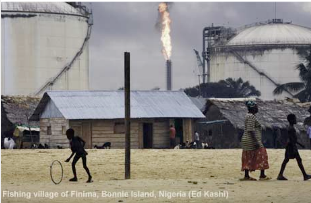
Fishing village of Finima, Bonnie Island, Nigeria (Ed Kashi)